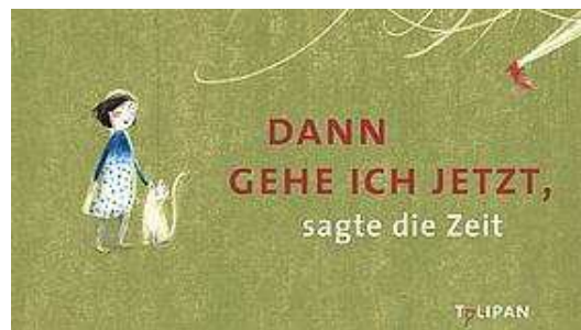
Titelbild des Buches.